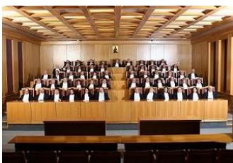
Δικαστήρια Ενόρκων Αιρετός Εισαγγελέας.