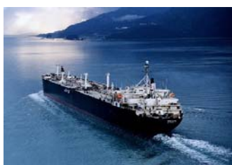
Η ναυτιλία, στους ναυτικούς.